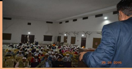
First aids Training Program