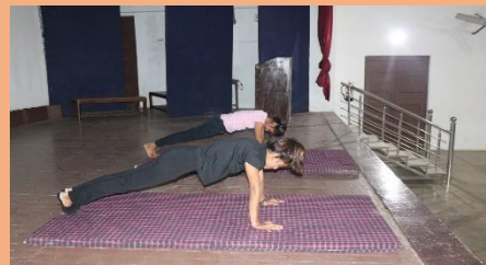
Self-Defense Training Program