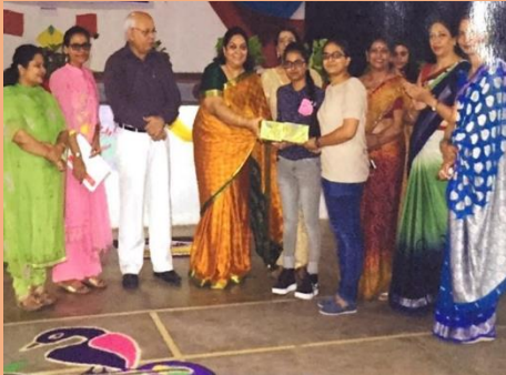
Teej Celebrations Function