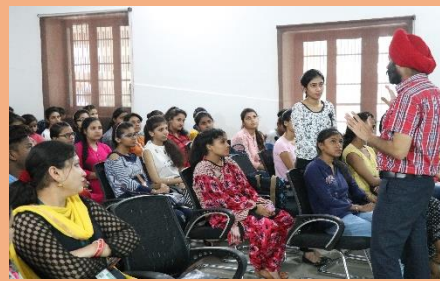
Extension Lecture on Toll free number