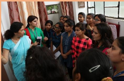
Workshop on use of Incinerator Machine