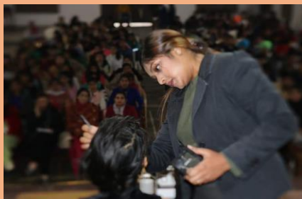
Workshop on Opportunity in Career