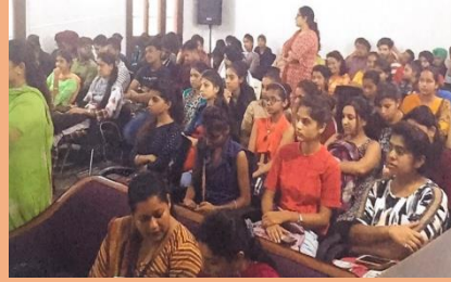
Extension Lecture on Drug- Abuse