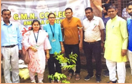
Tree Plantation Drive