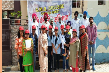
Awareness Camp on Adult Education