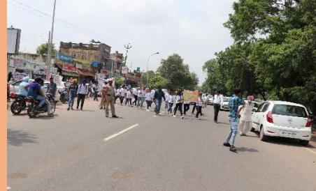
Rally on Beti Bachao- Beti Padhao