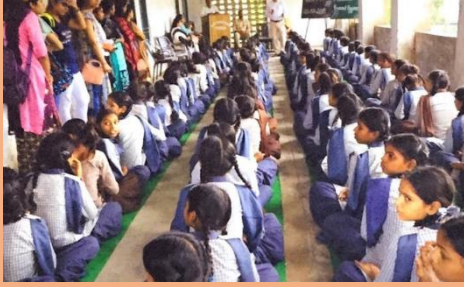
Extension Lecture on Health & Hygiene