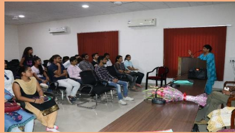
Extension Lecture on Stage Freight