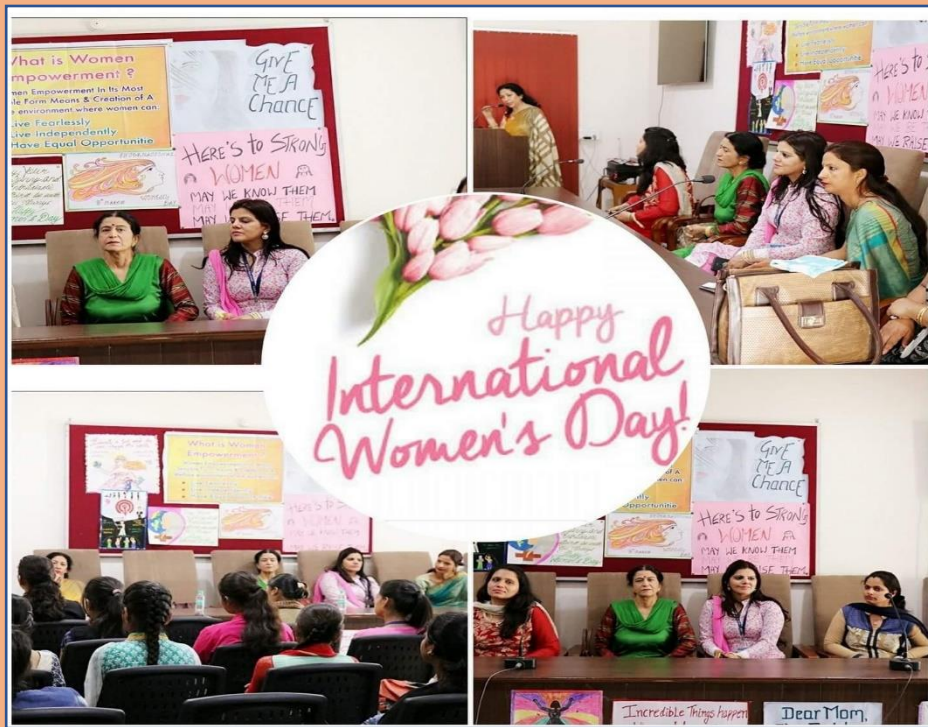
Celebrations of International Women's Day