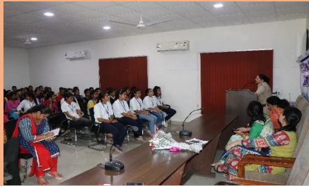
Extension lecture for SHE TEAM