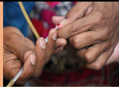
Blood Screening Test of Girl Students