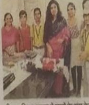
जीएमएन पब्लिक स्कूल में छात्राओं के संग के कार्यक्रम हुई प्रिंसिपल