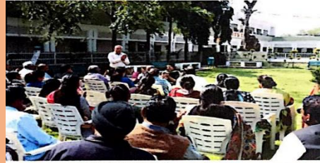
Corona Awareness Program