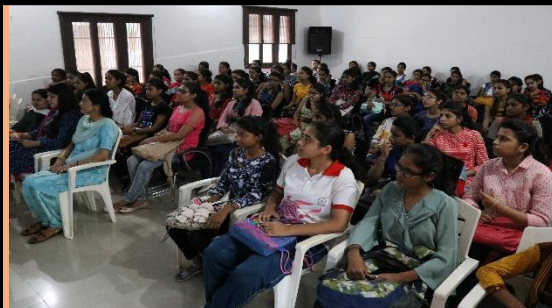
Pre-Marital Counselling Session