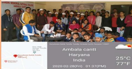
Health & Eye Check-up Camp