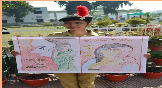
Slogan Writing Competition