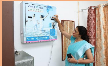
Workshop on use of Vending Machine