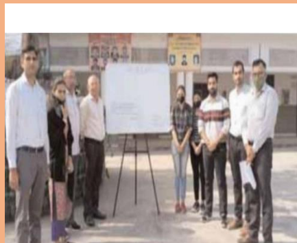
Signature Campaign on Women's Day