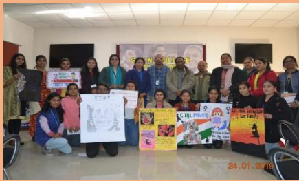
Celebration of Girl Child Day