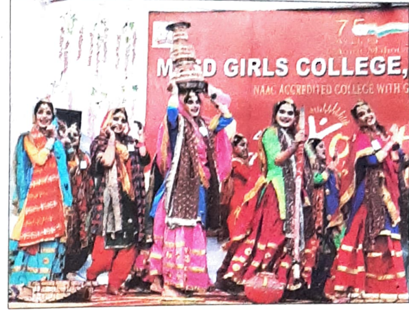
युवा महोत्सव में प्रस्तुति देती प्रतिभागी। संवाद