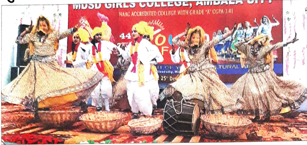
एमडीएसडी कॉलेज में आयोजित युवा महोत्सव में रसिया डांस प्रस्तुत करते प्रतिभागी।