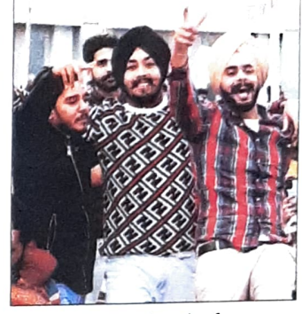
महोत्सव में डांस करते दरक।

कॉलेज अंबाला कैंट ने सोलो डांस हरियाणवी मेल, ग्रुप सॉनिंग जनरल, माइन्ड लाइट और लाइट वोकल इंडियन में प्रथम स्थान प्राप्त किया। क्लासिकल वोकल सोलॉ में जीएमएन कॉलेज अंबाला कैंट प्रथम रहा। वहीं माइन्ड और लाइट वोकल इंडियन में द्वितीय स्थान प्राप्त किया।