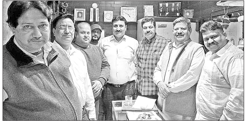
और व्यापारियों को आने वाली समस्याओं का समाधान भी शीघ्र किया जाएगा।